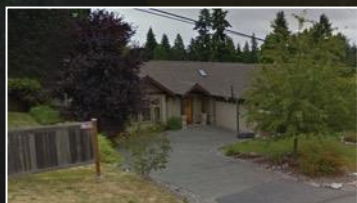
1994年我们的第一个仓库