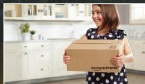
亚马逊 Prime 会员