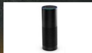
Alexa 与 Echo