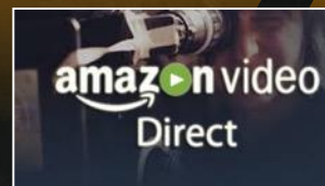
Amazon Video Direct