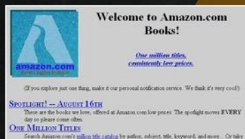
1995年我们的第一个网站主页